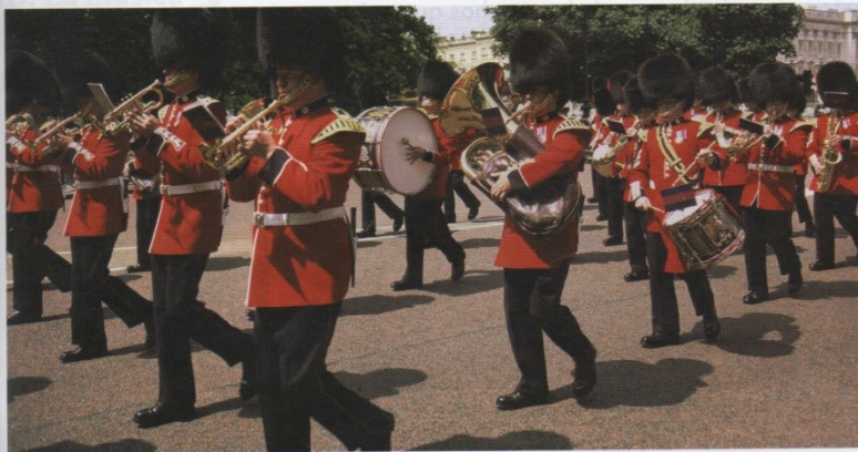
Figura 5.30. Imagen de una banda militar de música.