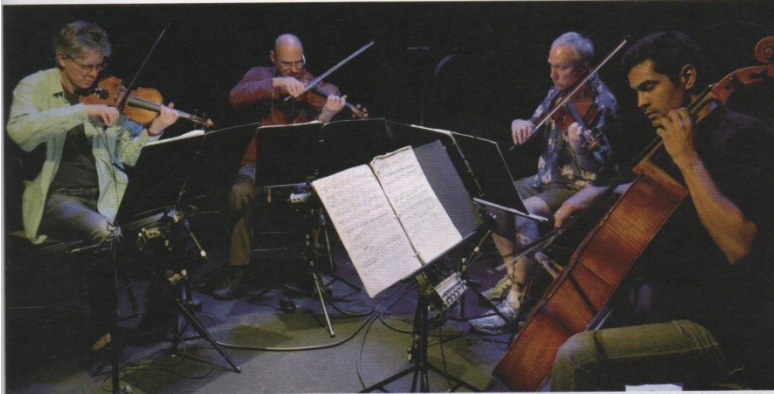
Figura 5.29. Imagen de un cuarteto de cuerda.

Por su gran importancia en el desarrollo de la historia de la música, cabe destacar el cuarteto de cuerda , formado por dos violines, una viola y un violonchelo.