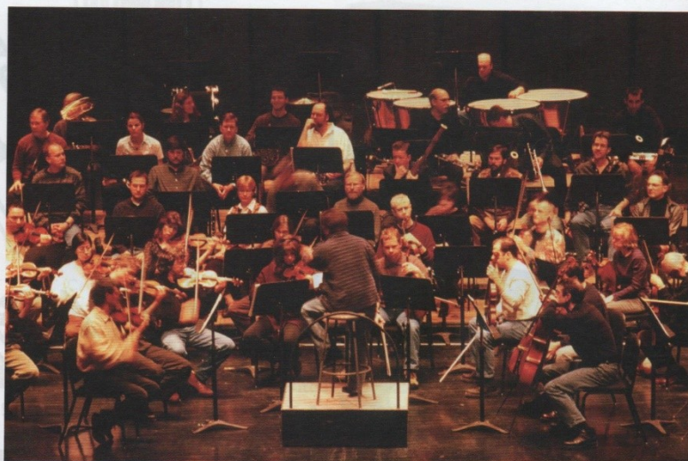
Figura 5.27. Orquesta sinfónica.

Desde que la orquesta se consolidó a finales del siglo XVII y principios del siglo XVIII, esta ha ido adquiriendo dimensiones cada vez mayores.